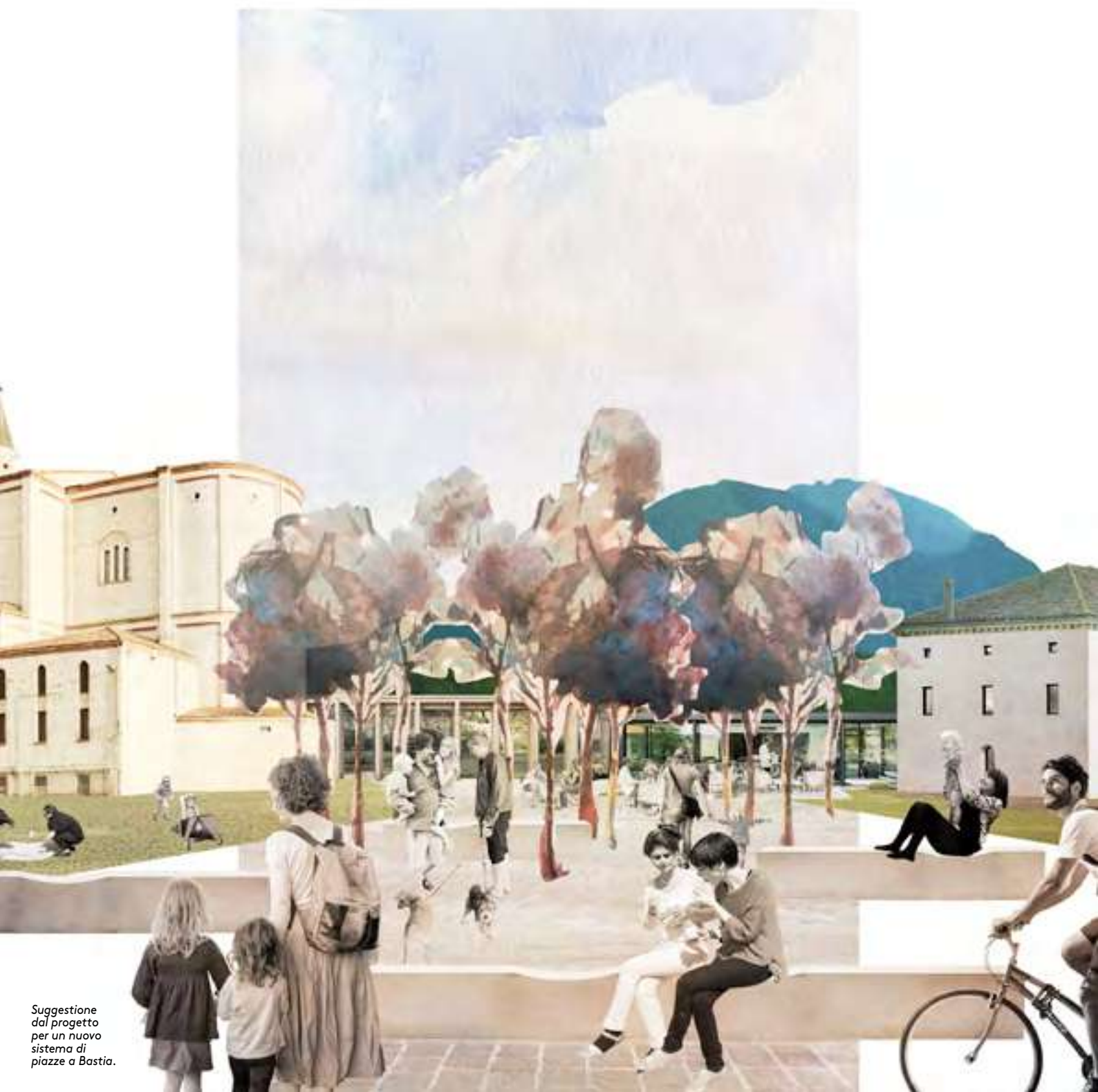
Suggerione dal progetto per un nuovo sistema di piazze a Bastia.