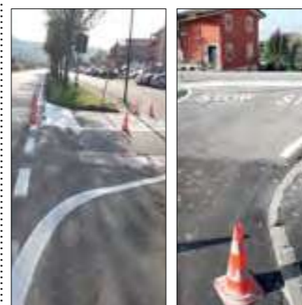
NUOVA SEGNALETICA ORIZZONTALE CARBONARA