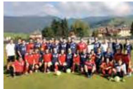
Il Presidente con il Direttivo

Il nuovo Direttivo insediato lo scorso anno ha portato a termine la prima stagione sportiva con buoni risultati, sia dal punto di vista della crescita umana e sportiva dei ragazzi sia dal punto di vista del miglioramento delle strutture. Inoltre è rientrata all'interno della Polisportiva, dopo ormai diversi anni, la pratica della pallavolo, a testimonianza del lavoro di inclusione e collaborazione voluto dal nuovo consiglio direttivo. L'annata sportiva 2018/19 procede bene, in modo particolare per i molti ragazzini che si sono avvicinati al calcio nelle categorie Piccoli amici e Primi calci, che permettono di guardare al futuro positivamente.