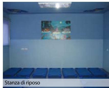
Stanza di riposo