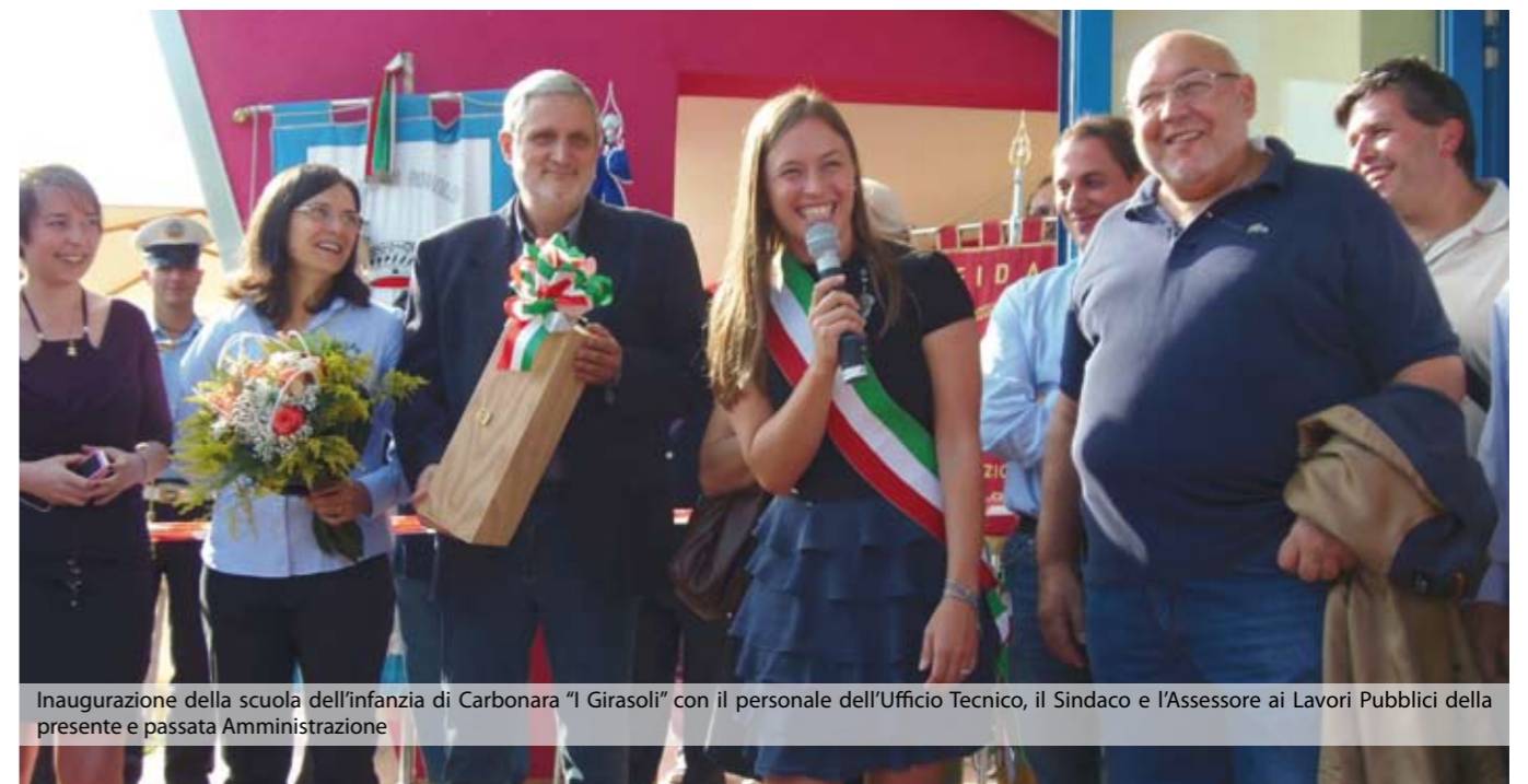
Inaugurazione della scuola dell'infanzia di Carbonara "I Girasoli" con il personale dell'Ufficio Tecnico, il Sindaco e l'Assessore ai Lavori Pubblici della presente e passata Amministrazione

Come potete capire, stiamo cercando di incentivare l'utilizzo di mezzi alternativi alla macchina: anzitutto, con la promozione di numerose piste ciclabili! La bicicletta è infatti la prima ottima alternativa all'auto: fa risparmiare soldi di benzina, soldi del dietologo o di medici di vario tipo, e regala serenità. Usate la macchina meno possibile, spostatevi in bicicletta, prendete l'autobus e, prima di tirar fuori l'auto dal garage, mettetevi d'accordo con i vostri amici, parenti o conoscenti che magari lavorano a Padova come voi ma usano la propria auto per fare la stessa strada incolonnati in mezzo al traffico dietro di voi, creando e respirando smog, spendendo inutilmente soldi e perdendo simpatiche nuove amicizie. Per questo, stiamo istituendo lo sportello CAR POLING, un modo per far incontrare domanda e offerta di passaggi in auto. Chi va a Padova ogni giorno in auto potrà venircelo a comunicare, in maniera che, trovando persone con la sua stessa esigenza, sia possibile farle incontrare e far loro condividere un po' di strada e, chissà, un po' di vita.