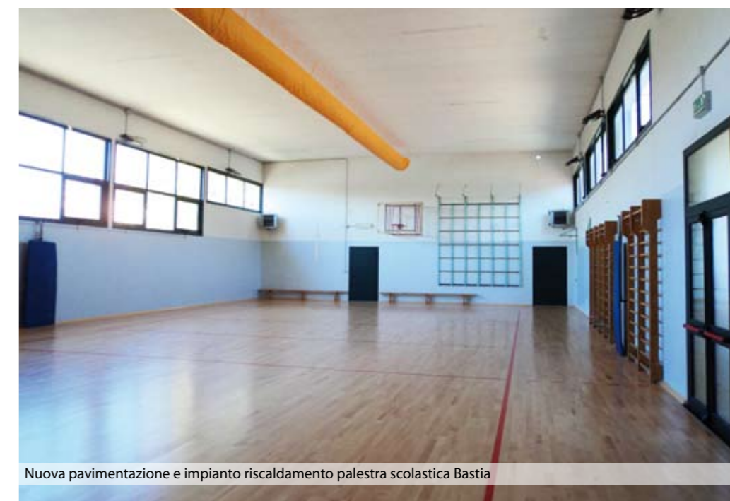
Nuova pavimentazione e impianto riscaldamento palestra scolastica Bastia