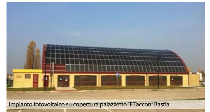
Impianto fotovoltaico su copertura palazzetto "F. Taccon" Bastia