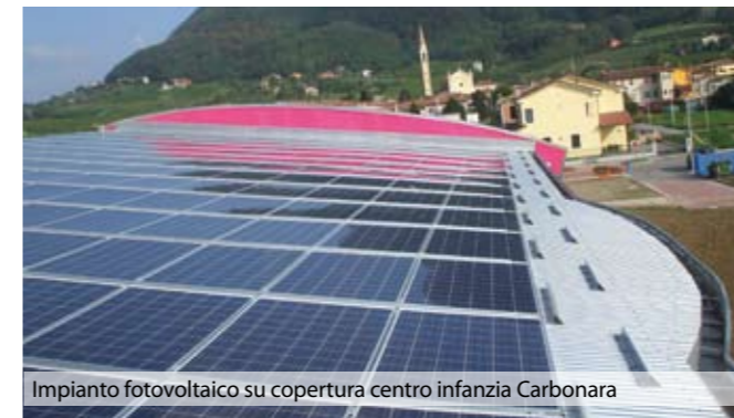
Impianto fotovoltaico su copertura centro infanzia Carbonara

vantaggi derivanti dall'autoconsumo dell'energia per un risparmio stimato di circa 20.000 euro l'anno. L'impianto installato nella scuola "I girasoli" è già attivo mentre a breve lo saranno anche i due impianti delle palestre comunali.