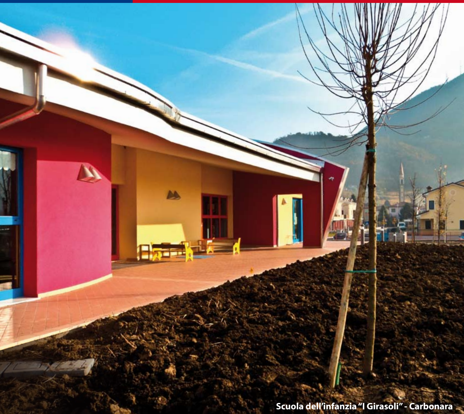
Scuola dell'infanzia "I Girasoli" - Carbonara