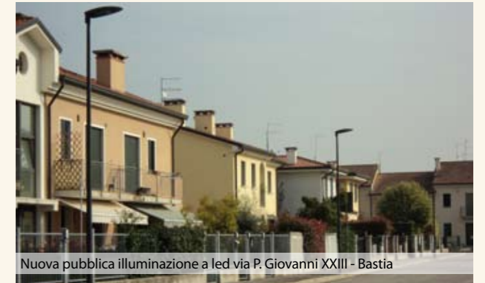
Nuova pubblica illuminazione a led via P. Giovanni XXIII - Bastia

Anche presso via Verdi e via Dante a Carbonara (dove si era provveduto lo scorso anno alla costruzione di percorsi ciclo-pedonali) si è proceduto all'installazione di nuovi impianti illuminanti LED.