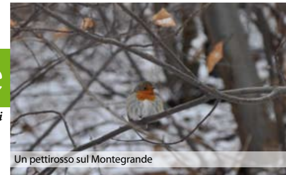
Un pettirosso sul Montegrande

Nella prospettiva di sostenere lo sviluppo economico stiamo pianificando l'ampliamento e la riqualificazione del Mercato domenicale in Bastia nonché l'introduzione di un Mercato agricolo - alimentare a Km zero. A breve il tradizionale Mercato di Natale, ideato per promuovere e sviluppare tutte le realtà produttive e associazioni locali.