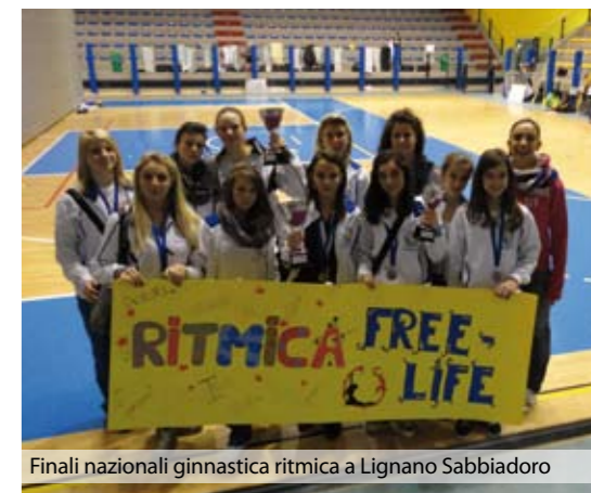
Finali nazionali ginnastica ritmica a Lignano Sabbiadoro