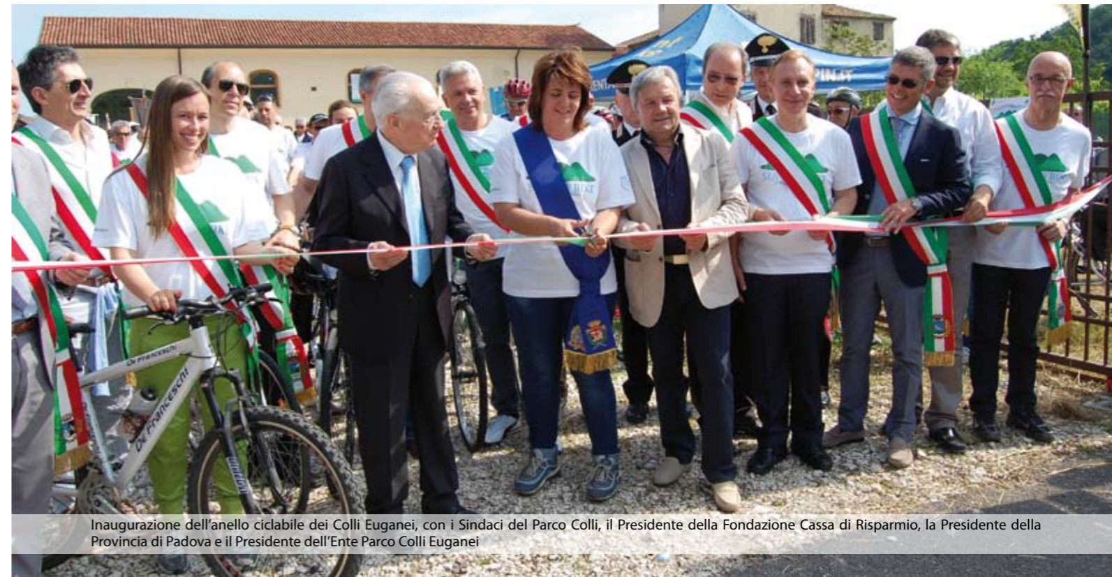
Inaugurazione dell'anello ciclabile dei Colli Euganei, con i Sindaci del Parco Colli, il Presidente della Fondazione Cassa di Risparmio, la Presidente della Provincia di Padova e il Presidente dell'Ente Parco Colli Euganei

Questo, in sostanza, è il futuro. Non possiamo e non vogliamo opporci. Crediamo che l'unione faccia davvero la forza, e crediamo che il confronto con il modo di lavorare di altri Comuni non possa che giovare reciprocamente a tutti. Abbiamo coinvolto anche le opposizioni in questo percorso e la collaborazione è stata buona. L'importante è non togliere servizi ai cittadini, e per questo stiamo lavorando, assieme agli altri Sindaci. Del resto, vedete che si tende a unire tutto: pensiamo all'Unione Pastorale, all'Istituto Comprensivo, alla Provincia di Padova-Treviso, che vedremo se rimarrà tale o se subirà ulteriori modifiche. Relativamente alla questione "PROVINCIA", ci sono molte variabili da considerare per cui, al momento, non mi sento di esprimere alcun giudizio. Garantisco comunque che