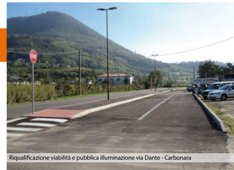
Riqualificazione viabilità e pubblica illuminazione via Dante - Carbonara

aiuole in piazza a Bastia, programmando un nuovo parco a Lovolo con ripristino della alberatura lungo la strada e collaborando con la ditta che sta ultimando i lavori del verde e le alberature nella nuova scuola di Carbonara "I Girasoli". L'impegno dell'Amministrazione però ha un riscontro se supportato dal senso di responsabilità e di rispetto che dobbiamo avere nell'uso delle attrezzature presenti nei parchi, del verde e delle strutture pub-