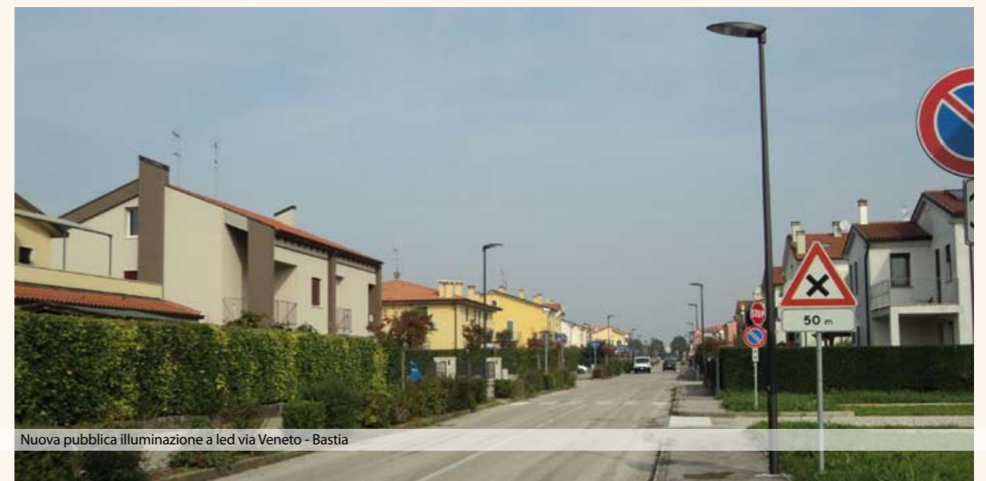
Nuova pubblica illuminazione a led via Veneto - Bastia