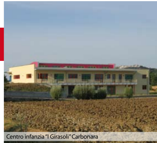
Centro infanzia "I Girasoli" Carbonara

L'opera, terminata nei tempi previsti e consegnata ai bambini del nostro comune in tempo per l'inizio dell'anno scolastico 2012/13, comprende lo spazio per accogliere 60 bambini di scuola dell'infanzia, suddivisi in due sezioni, la sala banda, il magazzino comunale, l'ambulatorio medico, una palestra e uno spazio che, al bisogno, potrà divenire asilo nido. Tutto è studiato per essere a misura di bambino, perché l'ambiente è un "veicolo" fondamentale per favorire la crescita: spazi ampi e luminosi, ricchi di colori e decorazioni, con finestre ad altezza bimbo. E' curata la sicurezza, anche con spigoli arrotondati, e il comfort