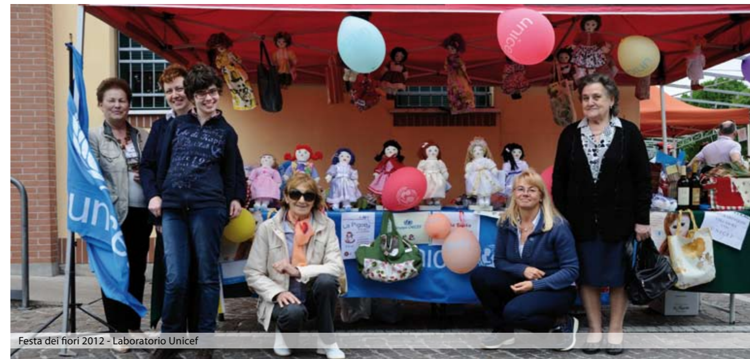
Festa dei fiori 2012 - Laboratorio Unicef