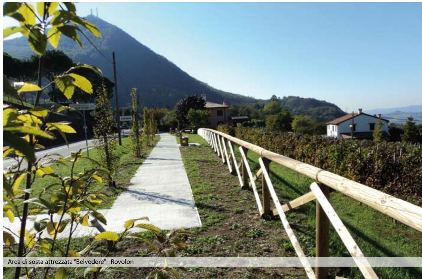
Area di sosta attrezzata "Belvedere" - Rovolon