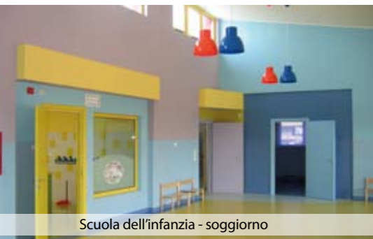
Scuola dell'infanzia - soggiorno

degli ambienti, dotati di ampie vetrate, acusticamente ben isolati, con riscaldamento a pavimento e finiture di pavimenti e pareti in gomma. L'edificio è completamente sostenibile grazie all'installazione di un impianto fotovoltaico e di un impianto solare-termico sul tetto, altamente coibentato, antisismico e posto in area aperta lontana da fonti di inquinamento.