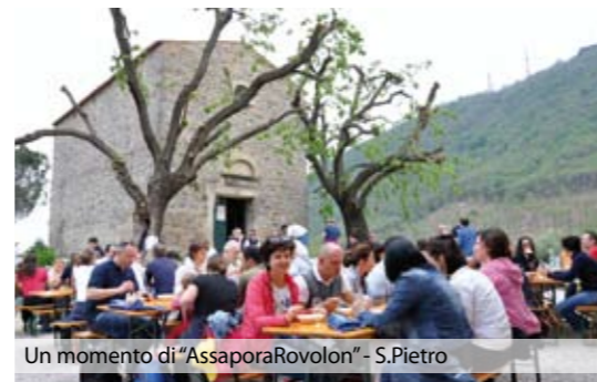
Un momento di "AssaporaRovolon" - S.Pietro

Abbiamo dato il via, in occasione della festa di San Martino, alla 1° nostra edizione della Giornata Europea dell'Enoturismo, grazie alla collaborazione con il Gruppo Le Fontane. E' stata organizzata una cena con vini e cibi tipici del nostro Paese. Hanno aderito alla manifestazione nove aziende vitivinicole che, con l'esperta illustrazione di una sommelier professionista, hanno reso la serata non solo piacevole dal punto di vista enogastronomico, ma anche ricca dal punto di vista culturale e della riscoperta delle tradizioni dei nostri nonni.