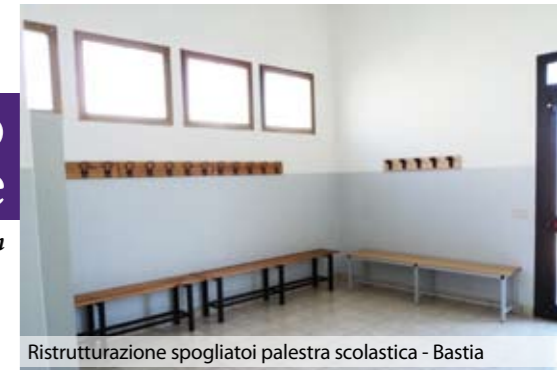
Ristrutturazione spogliatoi palestra scolastica - Bastia

Tutte le attività sopracitate sono sostenute in ugual modo dall'amministrazione ed alcune usufruiscono dei servizi comu-