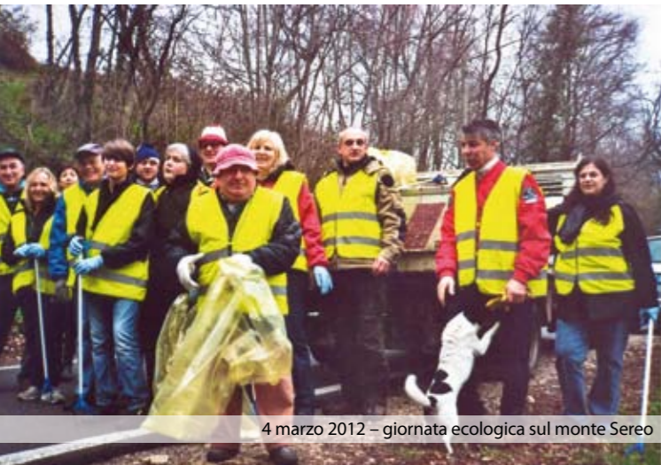
4 marzo 2012 - giornata ecologica sul monte Sereo